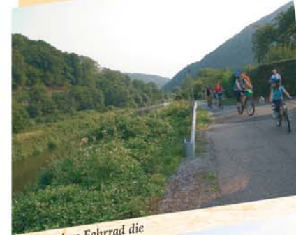
... mit dem Fahrrad die Landschaft entdecken ...