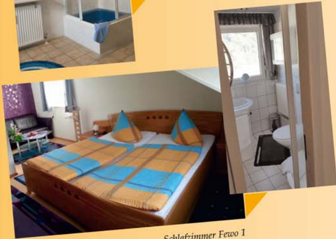
Schlafzimmer Fewo 1