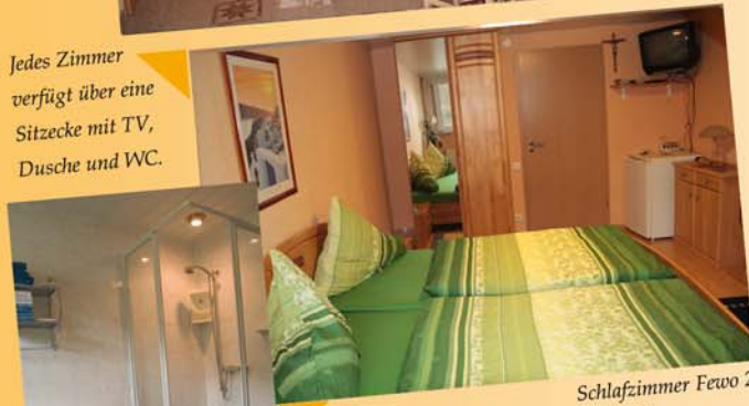
Jedes Zimmer verfügt über eine Sitzecke mit TV, Dusche und WC.