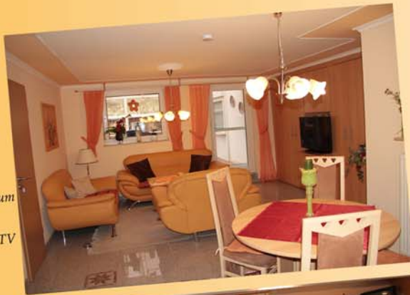
Aufenthaltsraum mit Ess- und Wohnecke & TV