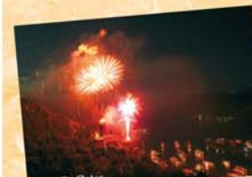
Rhein in Flammen 2. Wochenende im August

Deutschlands größter Blumenkorso - am letzten Augustwochenende in Bad Ems (1,5 Mio. Blumen, 1.500 Musiker & Majoretten)