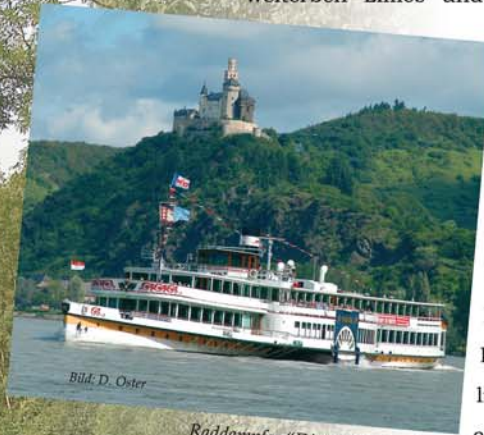
Raddampfer "Die Goethe" auf dem Rhein mit Blick auf die Marksburg

Nievern liegt direkt an der Lahn, am Fuße des Taunus, nicht weit von den beiden UNESCO Welterben "Limes" und "Oberes Mittelrheintal", mit seinen schönen Burgen und Schlössern. Umgeben von Wäldern, Wiesen und der gepflegten Uferlandschaft. Der saubere, einladende Ort hat mit 1100 Einwohnern seinen beschaulichen dörflichen Charakter bewahrt. Romantische Wege und herrliche Aussichten bieten abwechslungsreiche Möglichkeiten für Wanderer sowie für Fahrradfahrer (Fahrräder können bei uns gemietet werden). Auch den Anglern hat die Lahn manchen "Kapitalen" anzubieten.